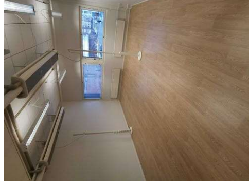
Kuva 26 Tarkistus onko riittävästi sähkötölppeä