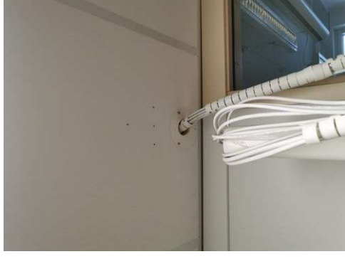
Kuva 10 Maalataan läpimeno sisältä ja reiät levystä. Käytävä huoneen edessä.