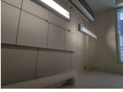
Kuva 18 Koukut pois ja kuput paikalleen A220.23. Ylimääräisiä koukkuja myös muissa tiloissa (yleismaininta)