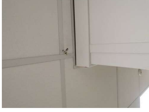
Kuva 4 Pihhat piiloon. Käytävä 212 huoneen 216.6 vieressä