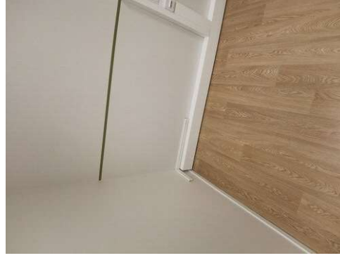
Kuva 5 Onko tarpeellinen lista?