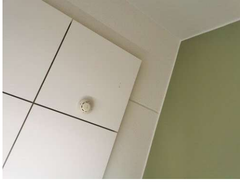
Kuva 13 Maalataan nirhauma A216.16