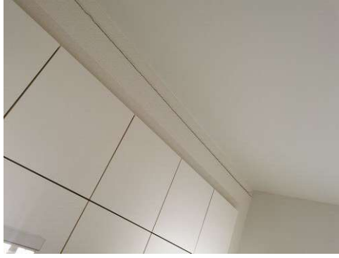
Kuva 21 Halkeaman ylimaalaus