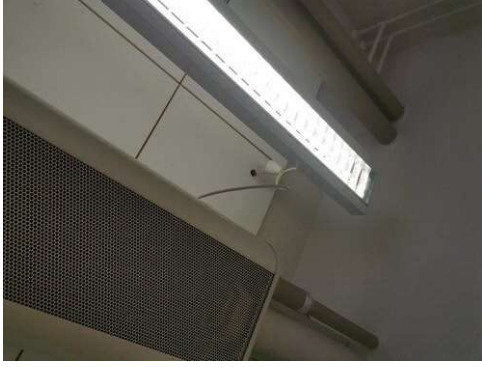
Kuva 15 Peitekupujen liimaus A218.2