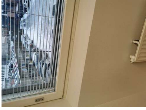
Kuva 22 Ikkunalistojen pesu. Ollut vanhoja teippejä