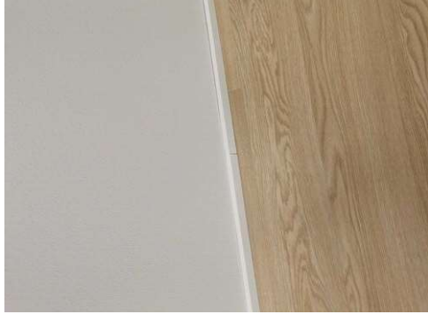
Kuva 28 Listan jatkon maalaus B220.22