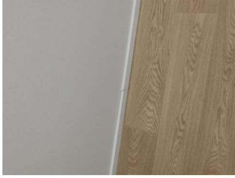
Kuva 27 Listan jatkon maalaus B220. 21