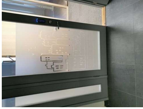
Kuva 3 Pysyykö vanhat teippaukset? Aula ja vaatesäilytys