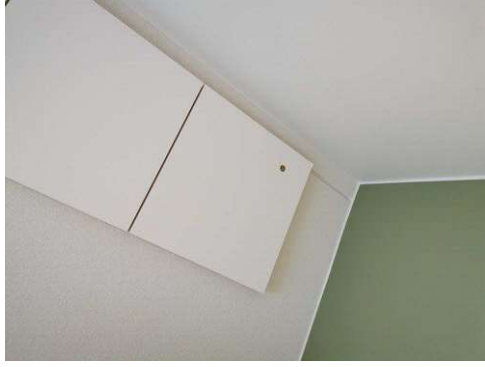
Kuva 1 Villojen reiät maalattava (yleisvaininta)