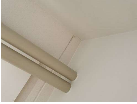
Kuva 11 Halkeaman yli maalaus