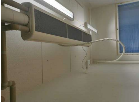
Kuva 24 Valaisin koukut pois katosta