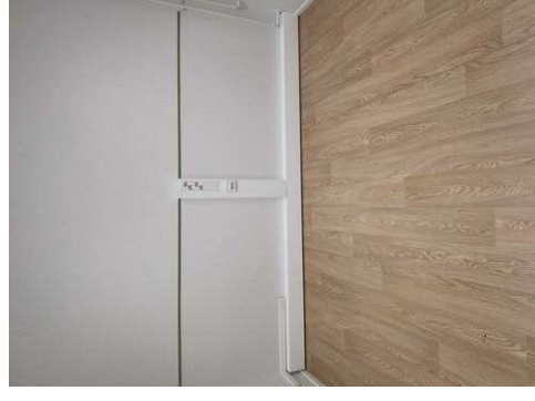
Kuva 6 Kourunosto ei tarpeellinen, pisteet voisi siirtää alas