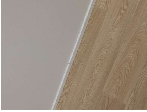
Kuva 19 Listan jatkon maalaus B223. 24