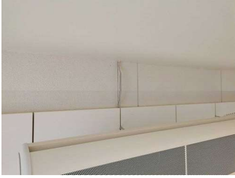
Kuva 17 Johto piiloon B220. 18