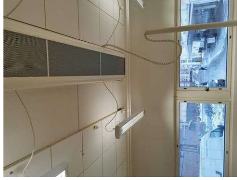
Kuva 25 Valokuvat paikalleen