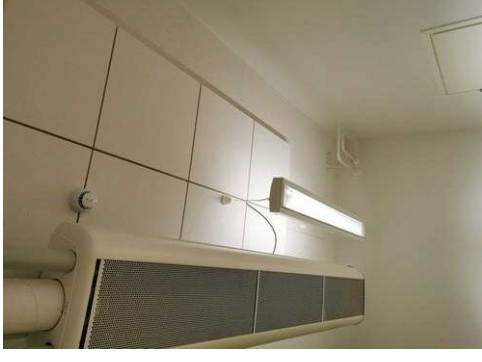
Kuva 16 Valaisin puuttuu, vain yksi valaisin A218.5