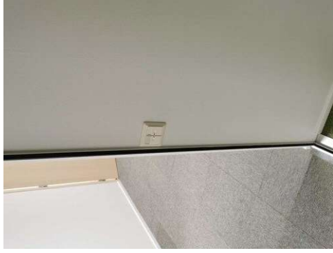
Kuva 7 Vanhat painikkeet, vaihto uusiin. Mestarin koppi