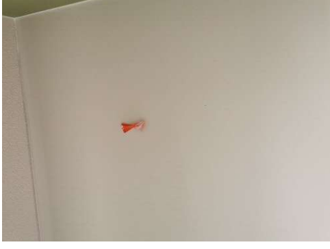
Kuva 12 A216.14 teippi pois