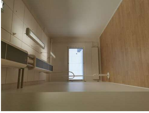
Kuva 23 Kattovillareikien maalaus