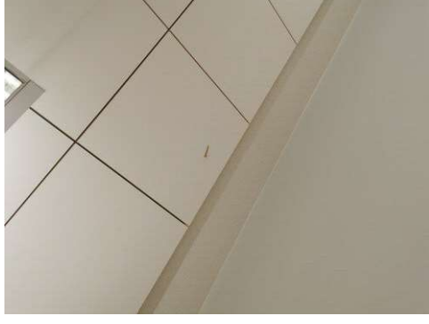
Kuva 14 Maalataan nirhauma A217.12