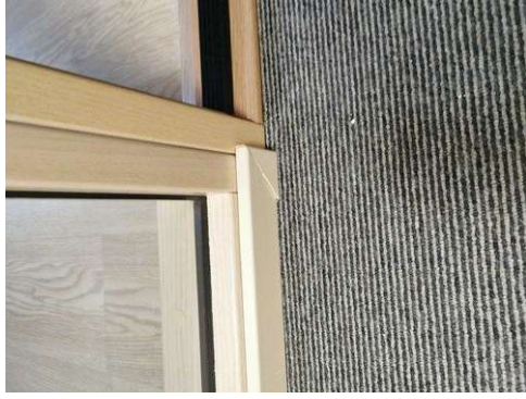
Kuva 9 Listan kääntö irti käytävän puolella huoneen edessä