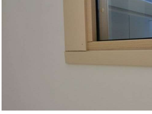
Kuva 8 Ovilista halki. Ovilista vaihdetaan